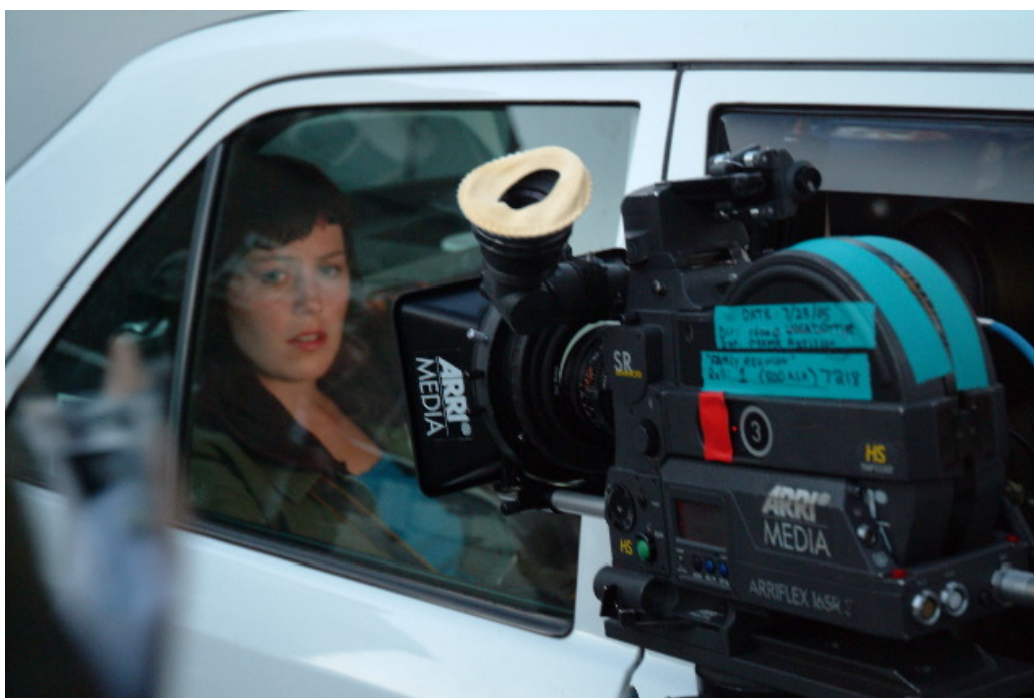
Från inspelningen av isländska filmen Kära gäster (2006) i Reykjavik

Filmer är beroende av det universella filmspråket, som med sin komplexitet av bild, ljud och scenografi kan beröra oss människor på djupet och ge oss möjlighet att arbeta i klassrummet. Filmerna berör oss inte bara med språket utan också med frågor om värdegrund och livshållning. Med filmernas hjälp kan vi låna andra människors ögon att se världen med och få erfarenheter som ger oss mod att bli mer öppna och toleranta.