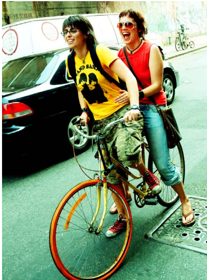
Från filmen Kära gäster (2006)

Rapporten Håller språket ihop Norden? kan laddas ner från http://www.norden.org/pub/kultur/kultur/sk/TN2005573.pdf .