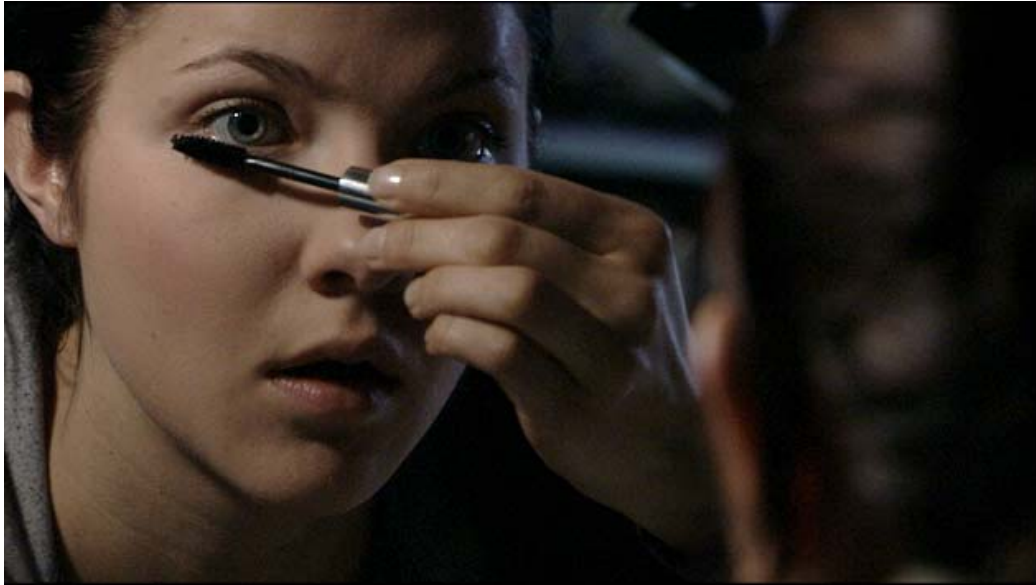
Från filmen Att leva, att existera (2007)

Medmänsklighet, människovärde, jämlikhet och tolerans har en central plats i nordiska läroplaner. Årets tema är därför starkt knutet till de uppgifter skolorna enligt läroplanerna har.