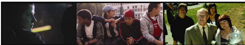
Bilder från filmerna "Att leva, att existera", "Elixir" och "Kära gäster"

Det troliga är att de flesta eleverna kommer fram till att folk i Norden förstår varandras språk bättre för att de nordiska språken är så nära besläktade med varandra.